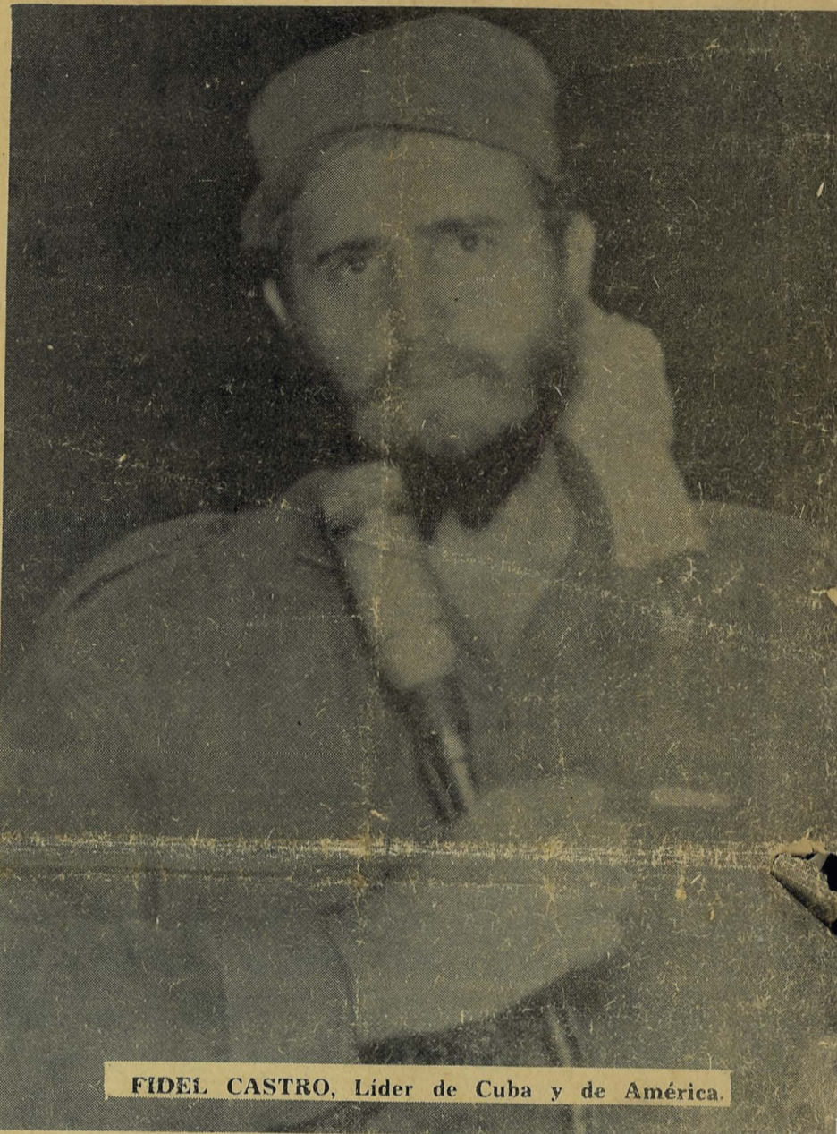
FIDEL CASTRO, Líder de Cuba y de América.

LIBERTAD quiere, en estos días aciagos para América Latina, expresar la confianza del Movimiento Social-Progresista en el triunfo de la liberación continental, cualesquiera que sean las fuerzas, los intereses, los dineros, las conspiraciones y los crímenes que el imperialismo oponga al anhelo de bienestar y progreso sin cadenas de las masas trabajadoras de todo el mundo, a cuya cabeza está Cuba.