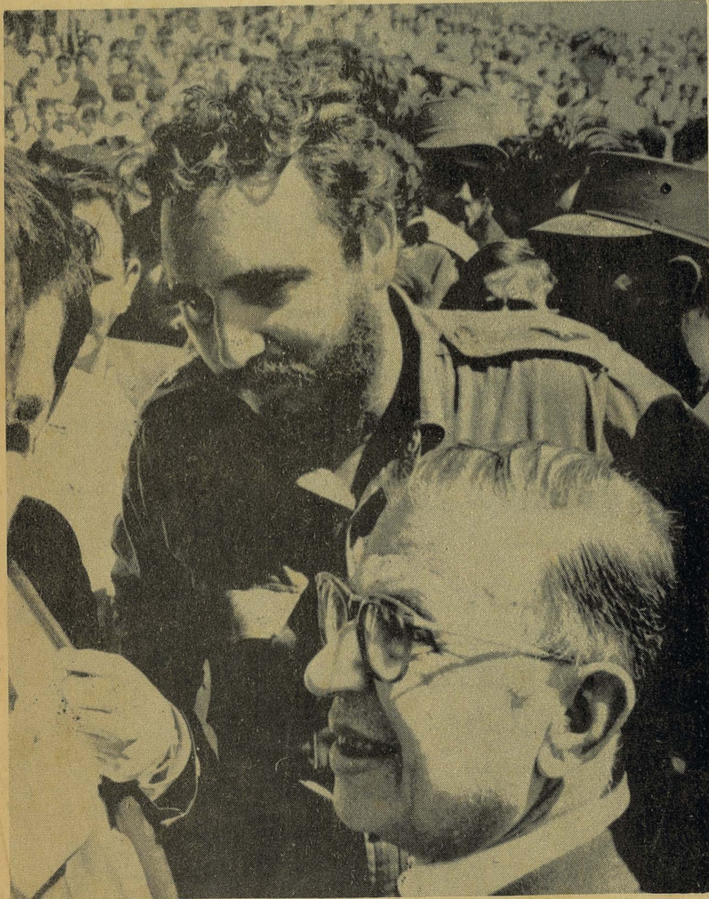
Fidel Castro y el mundialmente famoso escritor francés Jean Paul Sartre, con motivo de su visita a Cuba. De la revolución Cubana, Sartre ha dicho que es la única esperanza de la América Latina.

Con el dominio que tenemos de Cuba, dominio que muy pronto se convertirá en posesión, dominaremos prácticamente el comercio azucarero del mundo. Cuba bien vale por dos de cualesquiera de los Estados de Sur, probablemente hasta por tres, con exclusión de Texas; y la isla, con el ímpetu de los nuevos capitales y energías, se irá americanizando y tendremos, a su tiempo, una de las posesiones más ricas y deseables del mundo.